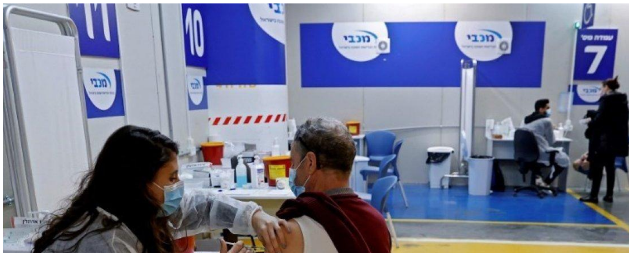
Vacunación en Tel Aviv el 26 de enero de 2021